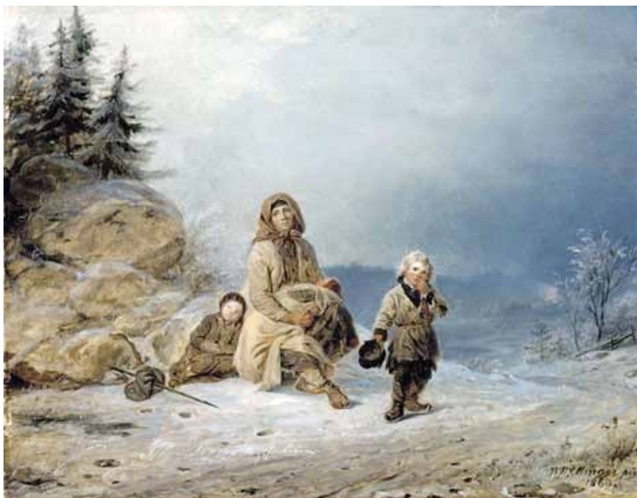
Kerjäläisperhe maantiellä. Robert Ekman. 1860.

se, että virallinen näläntorjuntapolitiikka oli suuntautunut aivan toisaalle. J.W. Snellman ja Suomen Talousseura olivat jo pitkään ajaneet kotitalousperusteista käsityöteollisuutta suosivaa politiikkaa. Valtion varoin ostettaisiin käsityöhön sopivia raaka-aineita ulkomailta ja niitä toimitettaisiin kunnille edelleen köyhille jaettavaksi. Näiden kotonaan tekemät tuotteet myytäisiin erityisten käsityöyhtiöiden välityksellä edelleen ulkomaille ja kotimaahan. Järjestelyn uskottiin pelastavan syrjäkyläisten köyhät ja siksi sen toteuttamiseen uhrattiin paljon aikaa ja rahaa. Yleisesti vallinneen laman ja puutteen takia ohjelman vaikutukset jäivät vähäisiksi.